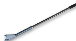
222219.900 Universal dækselnøgle