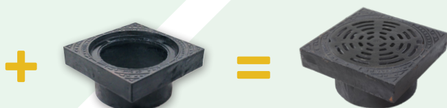
222212.344 Ø425 mm fast karm