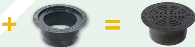
222212.244 Ø425 mm flydende karm